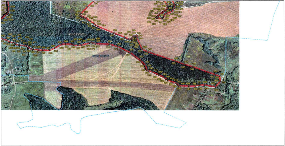
Выносной лист 5